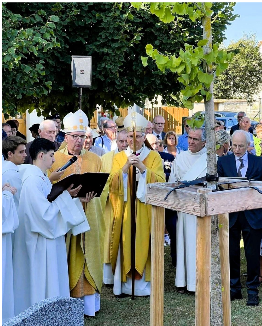
Bischof Kohlgraf bei der Ansprache und Segnung des Baums des Friedens und der Versöhnung. Anschließend enthüllen der Bürgermeister Jean-Jaques Roy und Friedhelm Boll die Plakette vor dem Versöhnungsbaum.