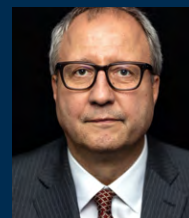
Prof. Dr. Dr. h.c. mult. Andreas Voßkuhle, Vorsitzender von Gegen Vergessen – Für Demokratie e. V.

Demokratie ist wichtig. Aber nicht selbstverständlich. Gegen Vergessen – Für Demokratie